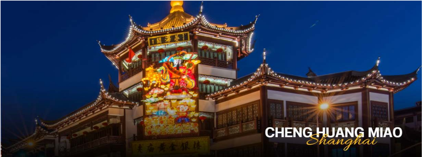
CHENG HUANG MIAO Shanghai