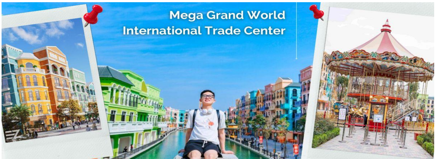
Mega Grand World International Trade Center

นำท่านออกเดินทางสู่ สถานที่ท่องเที่ยวแห่งใหม่ ของเมืองฮานอย ที่กำลังเป็นที่นิยมของนักท่องเที่ยวทั้งชาวต่างชาติ และชาวเวียดนามเอง Mega Grand World International Trade Center ตั้งอยู่ใจกลางของภาคเหนือ และที่นี่ยังเป็นแหล่งรวมความบันเทิงที่ทันสมัยที่สุด เพียบพร้อมไปด้วยร้านซ้อปปี้งมากมาย จุดหมายปลายทางสำหรับนักท่องเที่ยวที่ต้องการสัมผัสวัฒนธรรม ศิลปะ สถาปัตยกรรมร่วมสมัยของเอเชีย - ยุโรป ที่ถ่ายทอดผ่านทางอาคารบ้านเรือน และการตกแต่งด้วยกลิ่นไอความเป็นอิตาเลียน ท่านจะได้เพลิดเพลินไปกับ ร้านค้ามากมาย ให้เลือกซื้อของฝาก ต่างๆ และเต็มไปอ้อมไปด้วยมุมถ่ายรูปมากมาย ที่สามารถ ใช้เวลาเดินทาง ได้ตลอดทั้งวันไม่มีเบื่อ