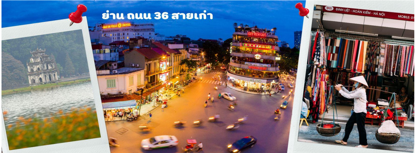
ย่าน ถนน 36 สายเก่า

จากนั้นให้ท่านได้ อีสรระซ้อปปี้ง ถนนสาย 36 street แหล่งซ้อปปี้งของฮานอย มีต้นไม้ปกคลุมสองฝั่งถนน สาเหตุที่ชื่อถนน 36 มาจาก 36 อาชีพที่ทำการค้าขายบนถนนแห่งนี้ ตั้งแต่อดีตอย่างงานด้านหัตถกรรมสอดคล้องกับชื่อถนนแต่ละเส้น ในอดีตอย่าง เครื่องเงิน ผ้าไหม บนถนนแห่งนี้ แต่ปัจจุบันมากกว่า 36 ไปแล้ว ที่นี่จะเป็นแหล่ง Shopping มีสินค้าเกือบทุกชนิด ร้านขายชุดกีฬาทุกแบรนด์เพราะที่นี่เป็นแหล่งผลิตให้หลาย ๆ แบรนด์