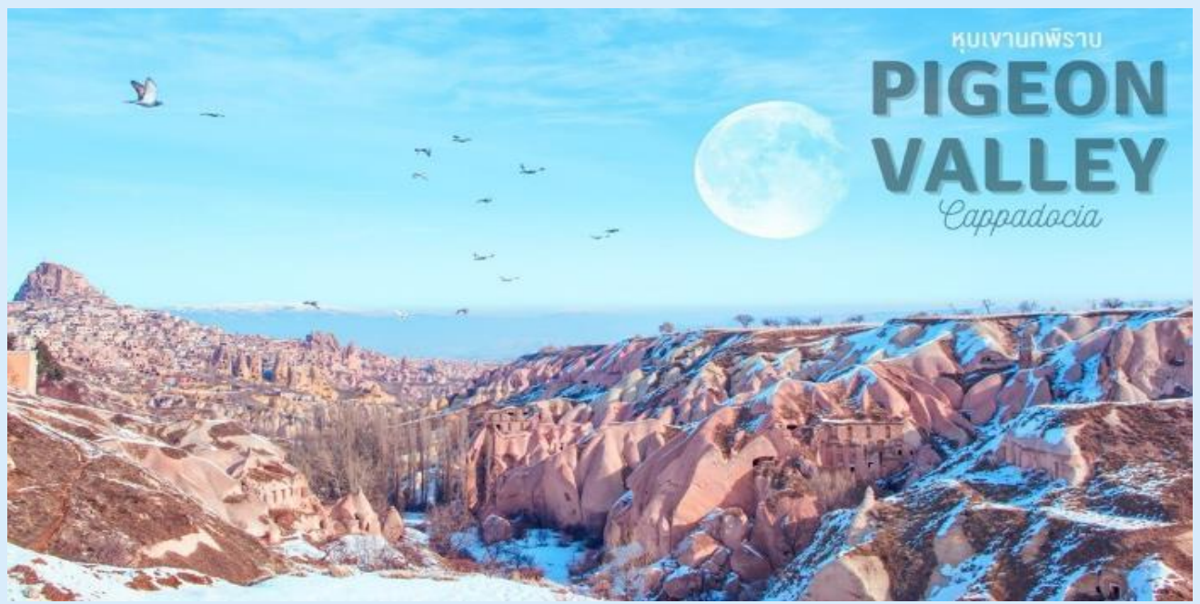
หุบเขานกพิราบ PIGEON VALLEY Cappadocia

แวะถ่ายรูป หุบเขานกพิราบ (PIGEON VALLEY) จุดชมวิวยู่ตรงบริเวณหน้าผาที่ชาวเมืองโบราณได้ขุดเจาะเป็นรู เพื่อให้นกพิราบเข้าไปทำรังอาศัยอยู่ ชาวบ้านเลี้ยงนกพิราบไว้เพื่อนำมูลมาทำเป็นปุ๋ยบำรุงต้นไม้ จากจุดชมวิวสามารถมองเห็นปราสาทอุชิซาร์ (UCHISAR CASTLE) และยังมีต้นไม้จำลองที่เต็มไปด้วยดวงตาสีฟ้าแขวนอยู่โดดเด่น อีสร่ถ่ายภาพตามอัธยาศัย