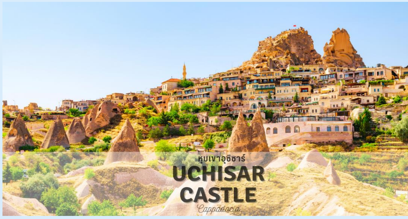
หุบเขาอุชิซาร์ UCHISAR CASTLE Cappadocia

แวะถ่ายรูป หุบเขานกพิราบ (PIGEON VALLEY) จุดชมวิวยู่ตรงบริเวณหน้าผาที่ชาวเมืองโบราณได้ขุดเจาะเป็นรู เพื่อให้นกพิราบเข้าไปทำรังอาศัยอยู่ ชาวบ้านเลี้ยงนกพิราบไว้เพื่อนำมูลมาทำเป็นปุ๋ยบำรุงต้นไม้ จากจุดชมวิวสามารถมองเห็นปราสาทอุชิซาร์ (UCHISAR CASTLE) และยังมีต้นไม้จำลองที่เต็มไปด้วยดวงตาสีฟ้าแขวนอยู่โดดเด่น อีสร่ถ่ายภาพตามอัธยาศัย