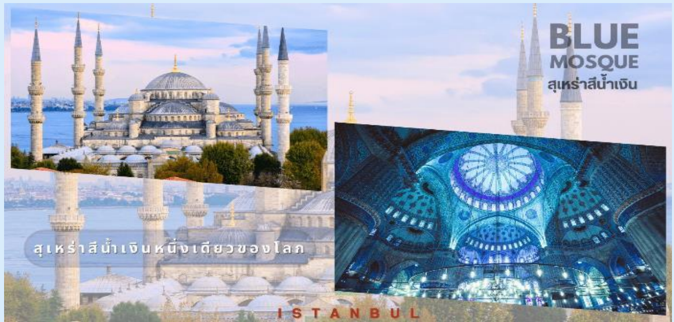
สุเหร่าสีน้ำเงินหนึ่งเดียวของโลก

นำท่านชม จัตุรัสสุลต่านอะห์เมต หรือ ฮิปโปโดรม (HIPPODROME) (ภายนอก) สนามแข่งม้าของชาวโรมัน จุดศูนย์กลางแห่งการท่องเที่ยวเมืองเก่า สร้างขึ้นในสมัยจักรพรรดิเซปติมิอุสเซเวรุสเพื่อใช้เป็นที่แสดงกิจกรรมต่างๆ ของชาวเมือง ต่อมาในสมัยของจักรพรรดิคอนสแตนติน ฮิปโปโดรมได้รับการขยายให้กว้างขึ้นตรงกลางเป็นที่ตั้งแสดงประติมากรรมต่างๆซึ่งส่วนใหญ่เป็นศิลปะในยุคกรีกโบราณในสมัยออตโตมันสถานที่แห่งนี้ใช้เป็นที่จัดงานพิธีแต่ในปัจจุบันเหลือเพียงพื้นที่ลานด้านหน้ามัสยิดสุลต่านอะห์เมตซึ่งเป็นที่ตั้งของเสาโอเบลิสก์ 3 ต้น คือเสาที่สร้างในอียิปต์เพื่อถวายแก่ฟาโรห์ทุตโมซิสที่ 3 ถูกลากกลับมาไว้ที่อิสตันบูลเสาต้นที่สอง คือ เสาสูง และเสาต้นที่สาม คือ เสาคอนสแตนตินที่ 7