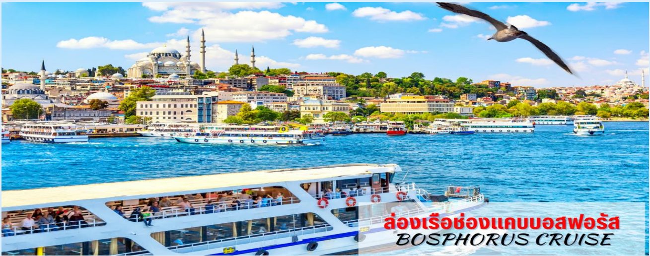
ล่องเรือช่องแคบบอสฟอรัส BOSPHORUS CRUISE

นำท่าน ท่องเที่ยวย่าน BALAT เป็นย่านที่เก่าแก่และสวยงามน่าตื่นตาตื่นใจเมื่อได้มาเยือน ตั้งอยู่ที่เมืองอิสตันบูล ประเทศตุรเคีย พื้นถนนปูด้วยหินก้อนโตๆ บ้านเรือนมีลักษณะเป็นตึก และมีสีฉูดฉาดแจ่มจรัส แต่มีอายุมากกว่า 50 ปีมาแล้ว ซึ่งในบางหลังมีอายุกว่า 200 ปีที่นี่เป็นสถานที่ยอดนิยมเป็นอย่างมาก ปัจจุบันมีคาเฟ่และร้านอาหารมากมายตั้งอยู่ที่นี่