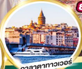
กาลาตาทาวเวอร์