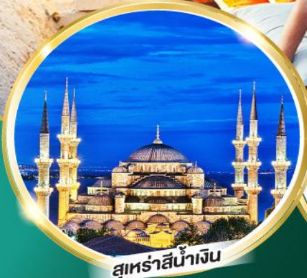
สุเหร่าสีน้ำเงิน

ฟรี!! พวงกุญแจ Evil Eye ชาแอปเปิ้ล, โยเกิร์ตมาโด