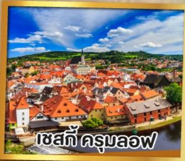
เซสท์ ครุมลอฟ