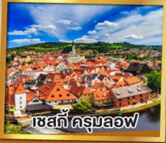
เซสท์ ครุมลอฟ