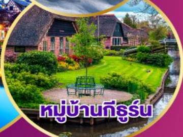
หมู่บ้านทึร์น