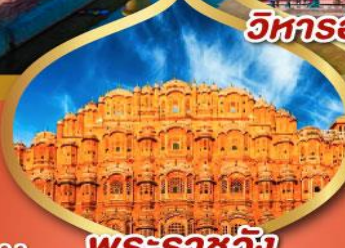
พระราชวัง สายลม