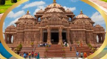
วิหารอักซาร์คัม