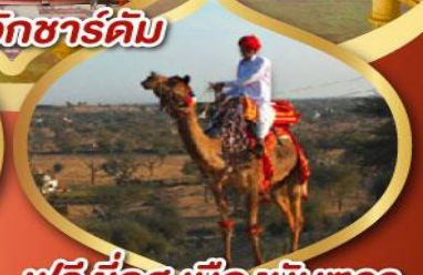
ฟรี ژیอฐ เมืองมันทอวา ราคาเริ่มต้น