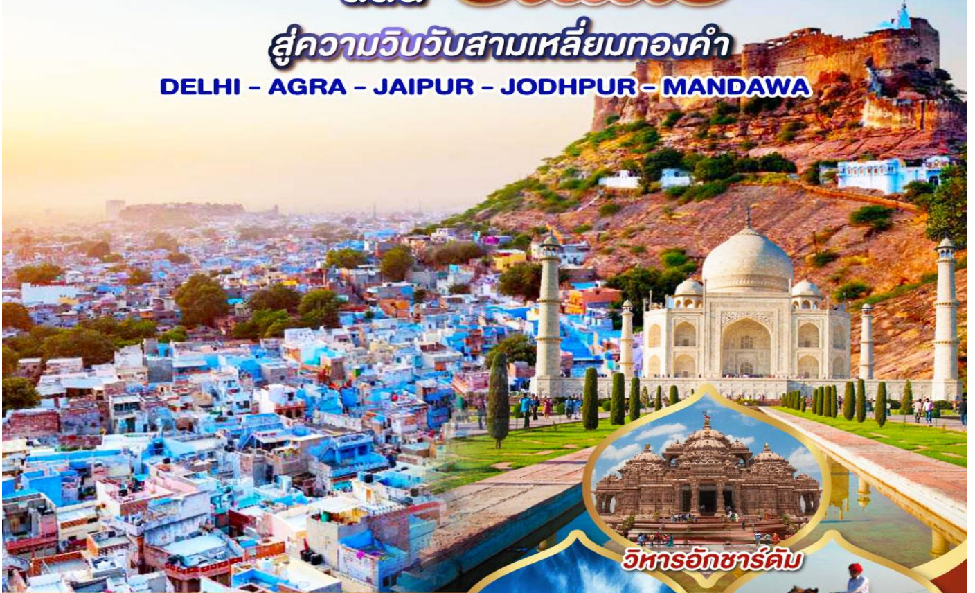
วิหารอักซาร์ดีม

DELHI - AGRA - JAIPUR - JODHPUR - MANDAWA