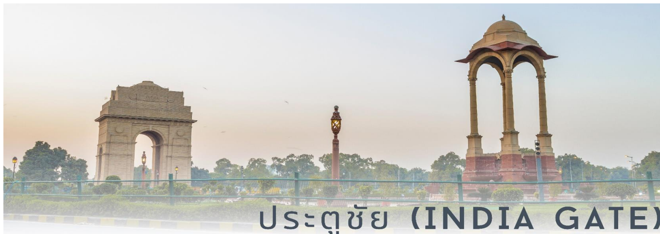
ประตูชัย (INDIA GATE)

จากนั้นนำท่านผ่านชม ประตูชัย (India Gate) เป็นอนุสรณ์สถานของเหล่าทหารหาญที่เสียชีวิตจากการร่วมรบกับอังกฤษในสมัยสงครามโลก ครั้งที่ 1 และสงครามอัฟกานิสถาน ประตูชัยแห่งนี้จึงถือได้ว่าเป็นสัญลักษณ์แห่งหนึ่งของกรุงนิวเดลี โดยซุ้มประตูแห่งนี้มีสถาปัตยกรรมคล้ายประตูชัยของกรุงปารีสและนครเวียงจันทน์ ซึ่งมีความสูง 42 เมตร สร้างขึ้นจากหินทรายเมื่อปีคริสต์ศักราชที่ 1931 ในอาณาบริเวณนี้ มีอีกหนึ่งสถานที่สำคัญที่สุดในอินเดีย คือ Rajpath ถนนราชปาด แปลว่า "ทางของกษัตริย์" เป็นถนนสำหรับประกอบพิธีกรรมที่ใช้ในช่วงวันสาธารณรัฐทุกปี ถนนสายนี้ตั้งอยู่บริเวณใจกลางเมืองเดลีและทอดยาวจากราชปถิวาน์ผ่านวิเจย์ โชคและประตู