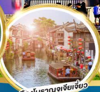
เมืองโบราณจูเจียเจี้ยว