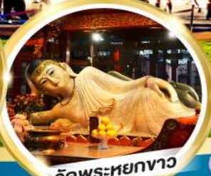
วัดพระหยกขาว