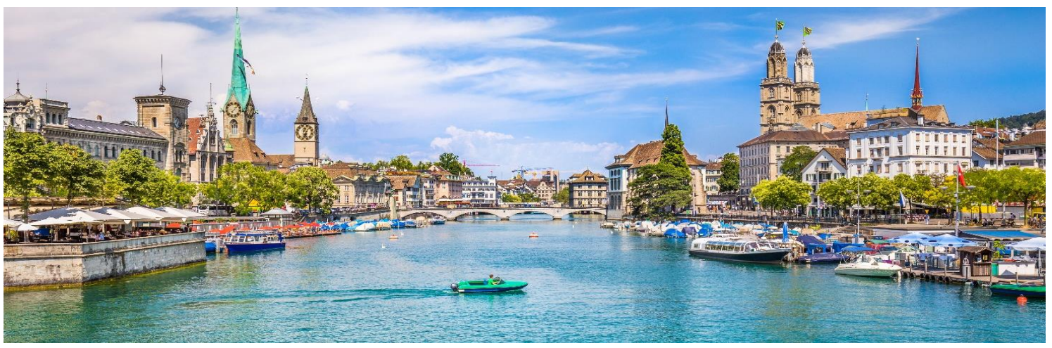
อิสระเดินเล่น ถนนบานโฮฟชตราเซอร์ (Bahnhofstrasse) ถนนการค้าเก่าแก่ที่รุ่งเรือง ตลอดสองข้างทางของถนน เรียงรายด้วยร้านค้าแบรนด์เนมระดับโลกมากมาย จนได้ชื่อว่า “ถนนช้อปปิ้งที่แพงที่สุดในโลก”