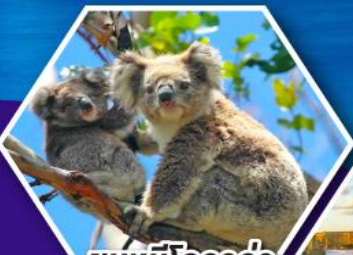
ชมหมีโคอาล่า ณ สวนสัตว์ซิดนีย์