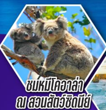
ชมหมีโคอาล่า ณ สวนสัตว์ซิดนีย์