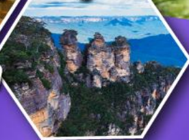
อุทยานบลูเมาส์แท่น