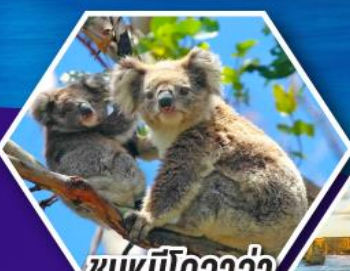
ชมหมีโคอาล่า ณ สวนสัตว์ซิดนีย์