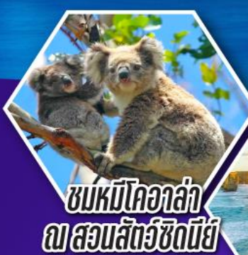
ชมหมีโคอาล่า ณ สวนสัตว์ซิดนีย์