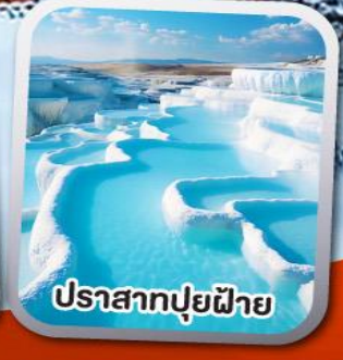
ปราสาทปูยฝ้าย