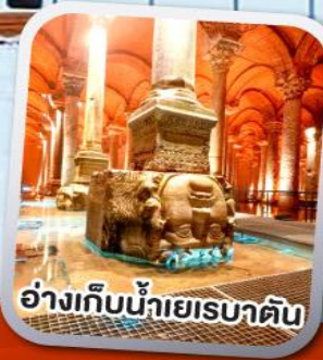
อ่างเก็บน้ำเยเรบาตัน