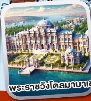
พระราชวังโดลมาบาเซ่