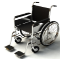
การรับการดูแลเป็นพิเศษ

กรณีผู้เดินทางต้องการความช่วยเหลือเป็นพิเศษ อาทิเช่น การใช้วีลแชร์ กรุณาแจ้งบริษัทฯ อย่างน้อย 7 วันก่อนการเดินทาง มิฉะนั้นบริษัทฯ จะไม่สามารถจัดการล่วงหน้าได้ เนื่องจากการขอใช้วีลแชร์ในสนามบินนั้น ต้องมีขั้นตอนในการขอล่วงหน้า และบางสายการบินอาจมีการเรียกเก็บค่าใช้จ่ายทั้งทางสนามบินในไทยและในต่างประเทศ ซึ่งผู้เดินทางสามารถสอบถามกับเจ้าหน้าที่ได้โดยตรงก่อนทำการจอง และหากในขณะของท่านมีผู้ต้องการดูแลพิเศษ เช่น ผู้ที่นั่งรถเข็น (Wheelchair), เด็ก, ผู้สูงอายุและผู้ที่มีโรคประจำตัวหรือไม่สะดวกในการเดินทางท่องเที่ยวในระยะเวลายาวเกินกว่า 4 - 5 ชั่วโมงติดต่อกัน ท่านและครอบครัวต้องให้การดูแลสมาชิกภายในครอบครัวของท่านเอง เนื่องจากการเดินทางเป็นหมู่คณะ หวังหน้าทัวร์มีความจำเป็นต้องดูแลคณะทัวร์ทั้งหมด