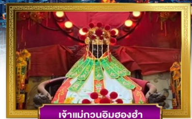
เจ้าแม่กวนอิมสองอำ