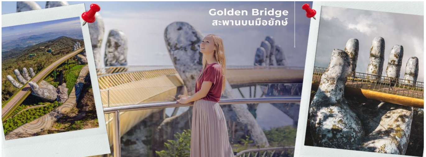
Golden Bridge สะพานบนมือยักษ์

CFDD5 ดานัง-ฮอยอัน-พักบานาฮิลล์ 3 วัน 2 คืน FD (MAY-OCT25)