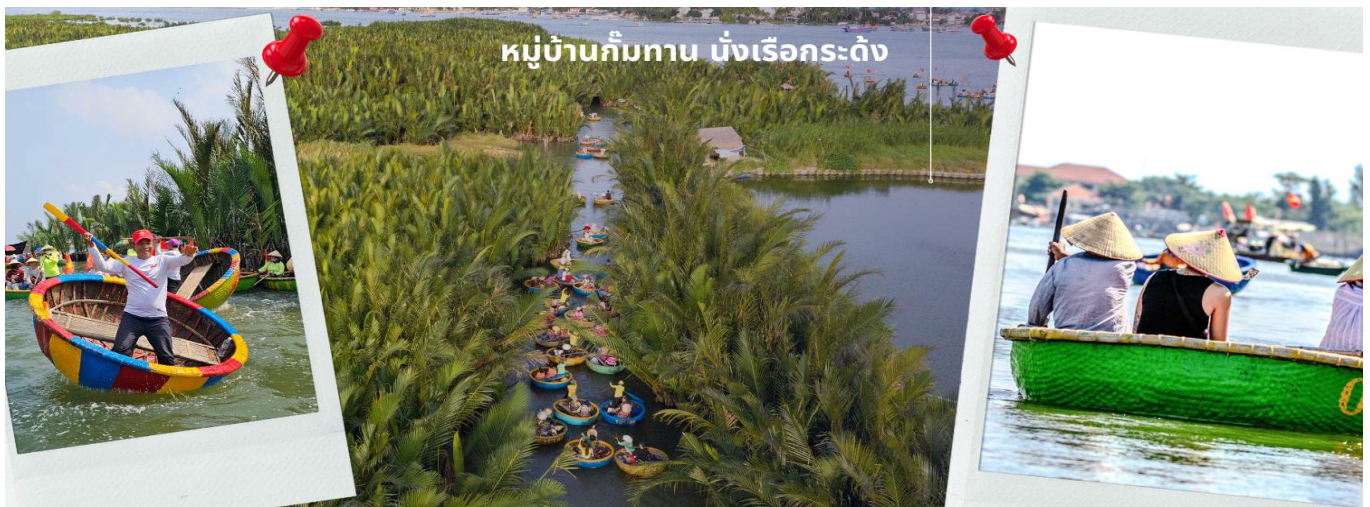
หมู่บ้านกิมทาน นั่งเรือกระดัง

จากนั้นนำท่านผ่านชม ภูเขาหินอ่อน Marble Mountains และนำท่านเข้าชม หมู่บ้านแกะสลักหินอ่อน ที่มีแหล่ง วัตถุดิบหินอ่อนเนื้อดี และช่างแกะสลักฝีมือประณีต ส่งออกจำหน่าย ทั่วโลก จากนั้นนำท่านเดินทางสู่ หมู่บ้านกิม ทาน สนุกสนานไปกับการเล่นกิจกรรม นั่งเรือกระดัง เป็นหมู่บ้านเล็กๆในเมืองฮอยอันตั้งอยู่ในสวนมะพร้าวริม แม่น้ำ ในอดีตช่วงสงครามที่นี่เป็นที่พักอาศัยของเหล่าทหาร อาชีพหลักของคนที่นี่คืออาชีพประมง ระหว่างการ ล่องเรือท่านจะได้ชมวัฒนธรรมอันสวยงาม ชาวบ้านจะขับร้องเพลงพื้นเมือง ผู้ชายกับผู้หญิงจะหยอกล้อกันไปมา ที่พายเรือมาเคาะกันเป็นจังหวะดนตรีสุดสนุกสนาน