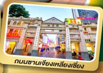
ถนนชานเจียงเหลียงเซียง