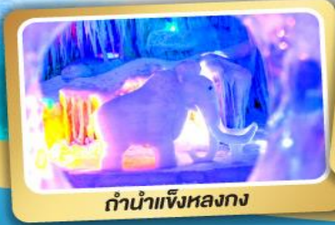
ตำนานเจิ้งหลงกง