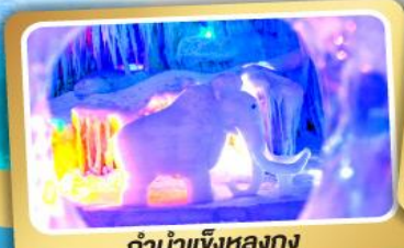
ตำนานเจิ้งหลงกง