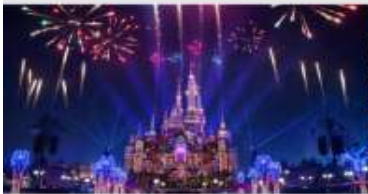
เซี่ยงไฮ้ดิสนีย์แลนด์