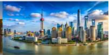
หาดไว่ถาน

*ทางบริษัทฯ ขอสงวนสิทธิ์ในการสลับโปรแกรมทัวร์ตามความเหมาะสมขึ้นอยู่กับสถานการณ์หน้างาน โดยคำนึงถึงผลประโยชน์ของลูกค้าเป็นสำคัญ