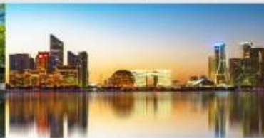
QIANJIANG NEW CITY