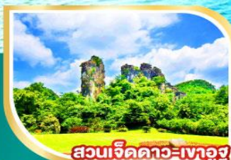
สวนจิตดาว=เงาอู๋