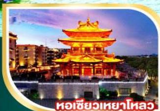
หอเซียวเหยาไหลว่