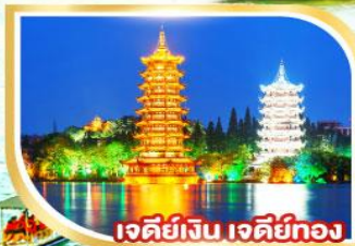
เจดีย์เงิน เจดีย์ทอง