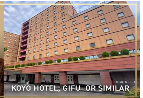
KOYO HOTEL, GIFU OR SIMILAR