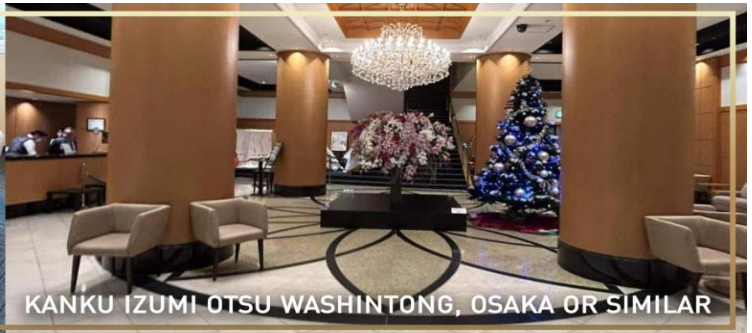
KANKU IZUMI OTSU WASHINTONG, OSAKA OR SIMILAR

วันที่ 5 สนามบินคันไซ – กรุงเทพฯ (ดอนเมือง) (B/-/-)