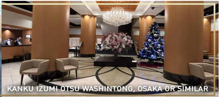
KANKU IZUMI OTSU WASHINTONG, OSAKA OR SIMILAR

วันที่ 5 สนามบินคันไซ – กรุงเทพฯ (ดอนเมือง) (B/-/-)