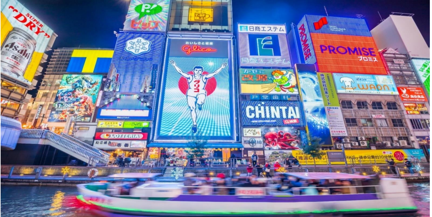
คำ อิสระอาหารตามอัธยาศัยเพื่อสะดวกแก่การช้อปปิ้ง ที่พัก KANKU IZUMI OTSU WASHINTONG, OSAKA หรือเทียบเท่า

นำท่านเดินทางสู่ ย่านชินไซบาชิ (SHINSAIBASHI) ย่านช้อปปิ้งชื่อดังของนคร โอซาก้า ภายในย่านนี้มีร้านค้าเก่าแก่ปะปนไปกับร้านค้าอันทันสมัย และสินค้าหลากหลายรูปแบบทั้งสำหรับเด็ก และผู้ใหญ่ ซึ่งย่านนี้ถือว่าเป็นย่านแสงสี และบันเทิงชั้นนำแห่งหนึ่งของนครโอซาก้า อีกทั้งยังมีร้านอาหารทะเลชั้นชื่อมากมาย สัญลักษณ์เด่นของย่านนี้คือ ตึกรูปเครื่องหมายการค้าของ กุลิโกะ ผลิตภัณฑ์ขนมชื่อดังจากญี่ปุ่นนั่นเอง