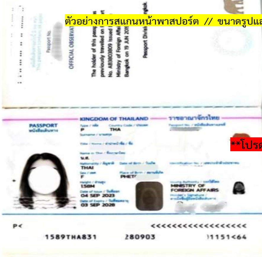
ตัวอย่างการสแกนหน้าพาสปอร์ต // ขนาดรูปและภาพของผู้เดินทาง