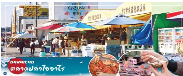
OARAICHO ตลาดปลาโออาริ

อิมมอรอยกับอาหารทะเลสดใหม่ส่งตรงมาจากท่าเรือประมงโออาริ อาทิ ข้าวหน้าปลาดิบ หรืออาหารทะเลปิ้งย่าง นอกจากนี้ยังมีอาหารทะเลตากแห้งที่ทำเองโดยชาวประมง ซึ่งเหมาะสำหรับเป็นของฝากอีกด้วย อีสระรับประทานอาหารทะเลสดๆ แบบปิ้งย่าง เพลิดเพลินกับหลากหลายเมนูปลาสดๆ เช่น ปลาอังโค ปลาชิราสุ (ปลาข้าวสาร) ตามแต่ฤดูกาล หอยเชลล์ หอยตลับ หอยนางรม หมึกย่างเนย และกุ้ง เป็นต้น