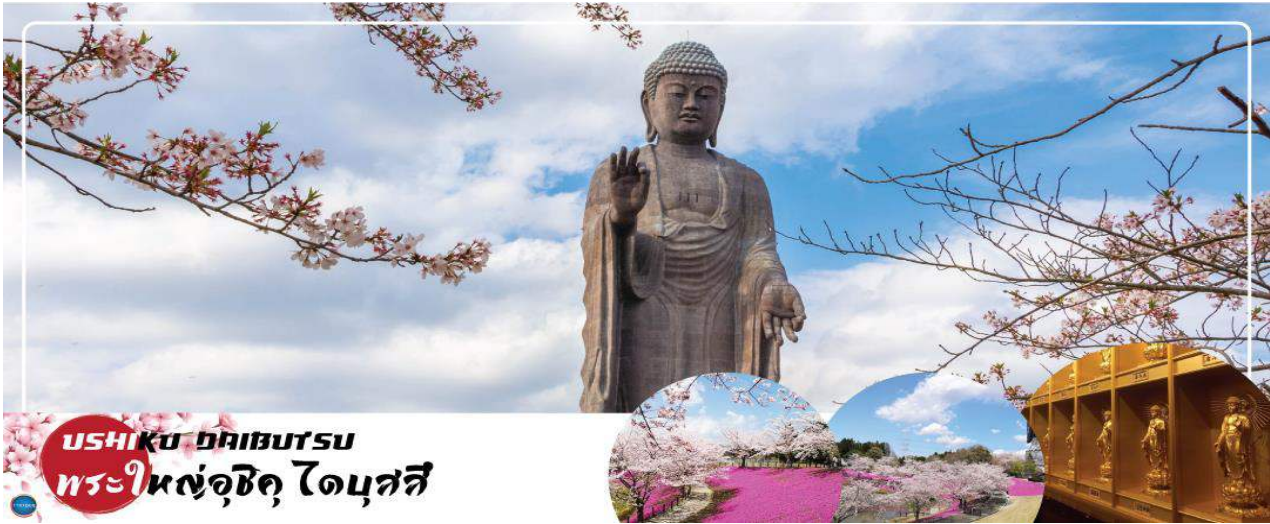
USHIKU DAIBUTSU พระใหญ่อุซึกุ ไดบุสึ

วันที่สี่ เมืองนาริตะ – เมืองอิบารากิ – พระใหญ่อุซึกุ ไดบุสึ – ตลาดปลาโออาริ – ศาลเจ้าโออาริอิโซซากิ – เสโทริแห่งคามิอิโซะ – เมืองนาริตะ – อีออน มอลล์ – ท่าอากาศยานนานาชาตินาริตะ