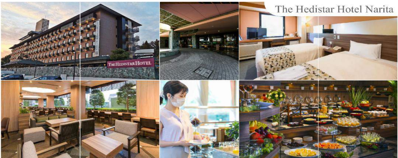
The Hedistar Hotel Narita

THE HEDISTAR HOTEL NARITA หรือระดับเดียวกัน