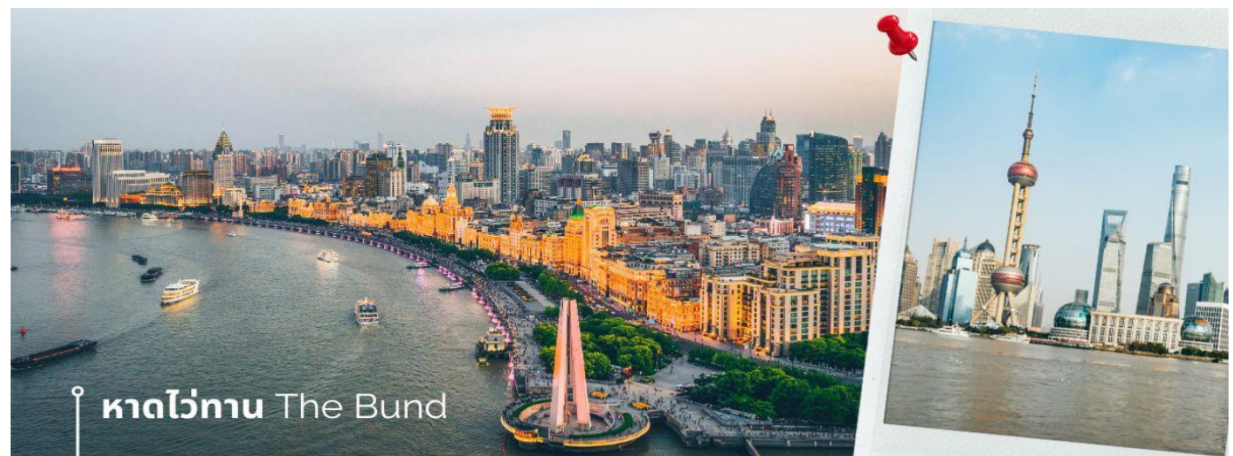
หาดไวท์ทาน The Bund

จากนั้นนำท่านเดินทางสู่แลนด์มาร์คของเมืองเชียงใหม่ นักท่องเที่ยวทั้งชาวจีนและชาวต่างชาติ ต่างพากันมาถ่ายรูปอย่างไม่ขาดสาย เมื่อมาถึงเมืองเชียงใหม่ นั่นคือ หอไข่มุกตะวันออก Oriental Pearl Tower (ผ่านชม) เป็นหอส่งสัญญาณวิทยุโทรทัศน์สูง 468 เมตร ลักษณะเป็นไข่มุก 11 ลูก และ เสา 3 เสา ด้านบนเป็นรูปไข่มุก 3 เม็ด 3 ขนาดเรียงกันในแนวตั้ง