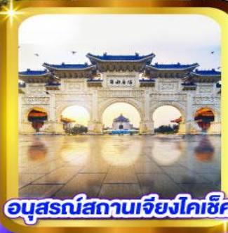
อนุสรณ์สถานเจียงไคเช็ค