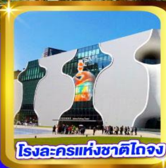
โรจระครแห่งชาติไถจง