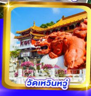
วัดเหวินหวู่