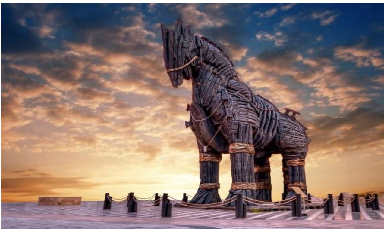
นำท่านชมและถ่ายภาพ ม้าไม้จำลองเมืองทรอยริมทะเล (TROJAN STATUE/HOLLYWOOD HORSE) เป็นม้าไม้ที่มีชื่อเสียงโด่งดังมากที่สุดจากมหากาพย์ภาพยนตร์ฮอลลีวูดเรื่อง ทรอย (Troy) ในปี 2004 มีแบรด