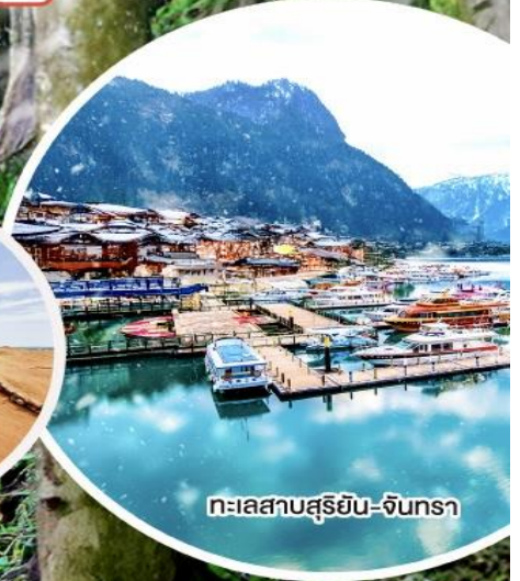
ทะเลสาบสุริยัน-จันทรา