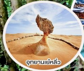
อุทยานยี่หลี่