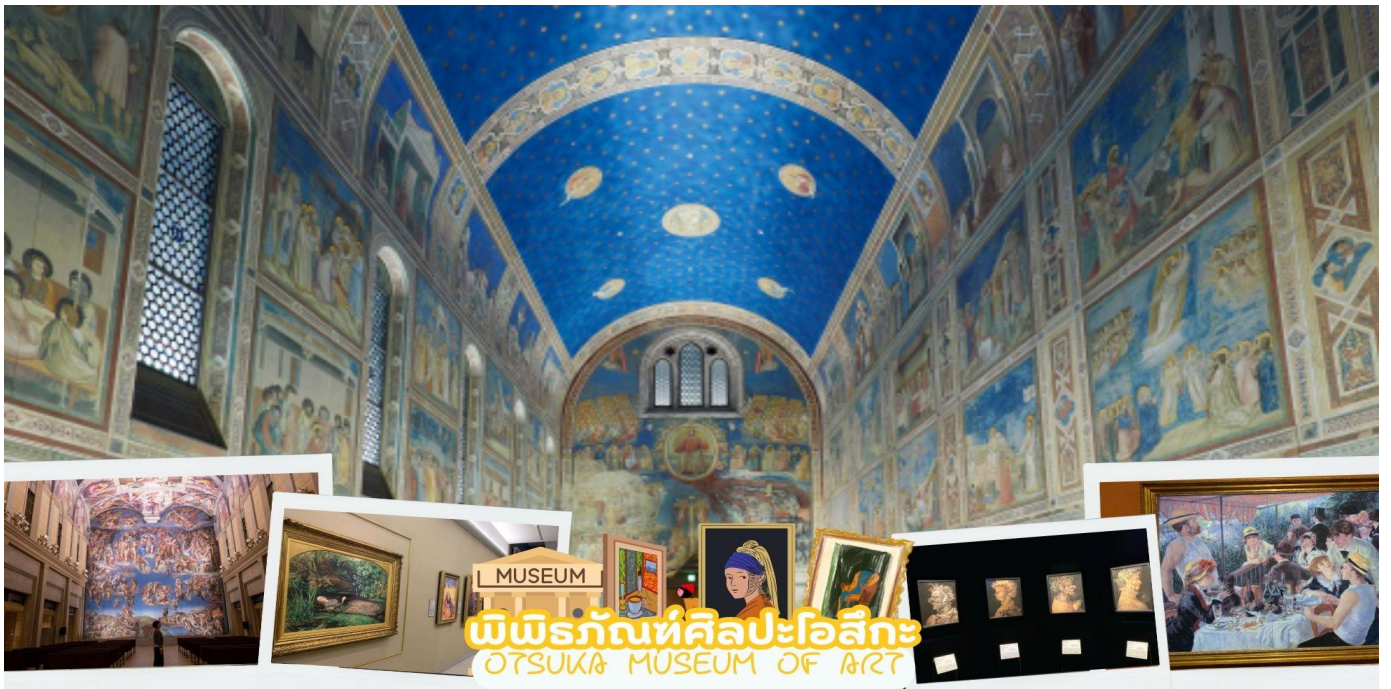
พิพิธภัณฑ์ศิลปะโอสึกะ OTSUKA MUSEUM OF ART

พิพิธภัณฑ์ศิลปะโอสึกะ (Otsuka Museum of Art) นั้นตั้งอยู่ภายในพื้นที่สวนสาธารณะนารุโตะ เป็นพิพิธภัณฑ์ศิลปะที่มีขนาดใหญ่ที่สุดในญี่ปุ่น ภายในพิพิธภัณฑ์แห่งนี้เป็นที่รวบรวมผลงานศิลปะระดับมาสเตอร์พีซจากศิลปินชื่อดังไปจนถึงภาพวาดร่วมสมัยกว่า 190 แห่ง ใน 26 ประเทศทั่วโลกมาจัดแสดงกว่า 1,000 ชิ้น อาทิ ไมเคิล แองเจโล (Michelangelo) โกลด์ โมเนต์ (Claude Monet) เลโอนาร์โด ดา วินชี (Leonardo da Vinci) ให้ได้ชมอย่างเพลิดเพลิน และเนื่องจากภาพวาดที่จัดแสดงในพิพิธภัณฑ์แห่งนี้เป็นภาพที่คัดลอกมา ไม่ใช่ภาพต้นฉบับจึงอนุญาตให้ผู้เข้ามาชมสามารถสัมผัสสายละเอียดของภาพวาดอย่างใกล้ชิด รวมทั้งถ่ายภาพเป็นที่ระลึกได้ตามต้องการ หลังจากเพลิดเพลินกับผลงานศิลปะของพิพิธภัณฑ์แล้ว ที่นี่ก็มีคาเฟ่และร้านอาหารซึ่งตั้งอยู่ที่ชั้นใต้ดิน B2F ให้แวะพักผ่อน รับประทานอาหารของอร่อย นอกจากนี้ที่ชั้นใต้ดินก็ยังมี Museum Shop ที่มีสินค้าจากพิพิธภัณฑ์ที่น่าสนใจมากมายสำหรับผู้ชื่นชอบงานศิลปะ เช่น ปากกา ไปสการ์ดภาพศิลปะ ขนม สินค้าเบ็ดเตล็ดต่าง ๆ ซึ่งเป็นสินค้าออริจินัลของทางพิพิธภัณฑ์วางจำหน่ายอีกด้วย