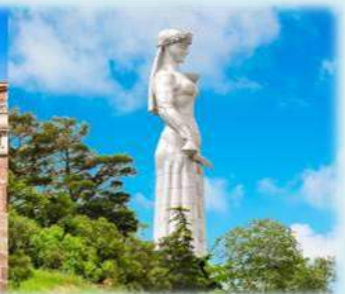
หน้า 13 (ภาพ ซเฟอการเมชันนาเกานน)