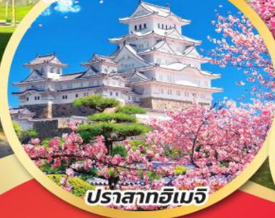
ปราสาทอิเมจิ