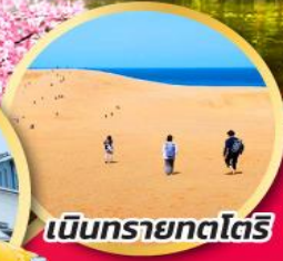
เนินทรายทตโตริ