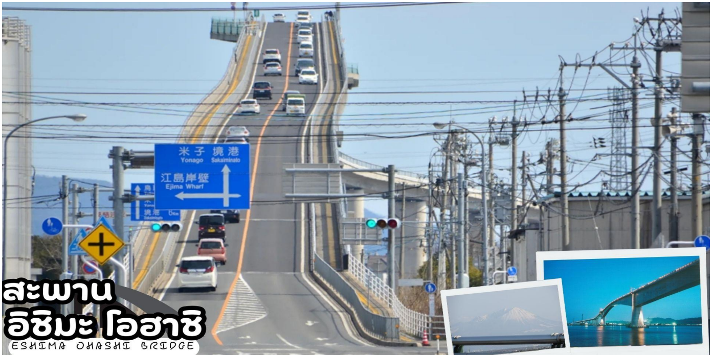
สะพาน อิชิมะ โอฮาชิ ESHIMA OHASHI BRIDGE

ได้รับความนิยมเป็นอย่างมากและว่ากันว่าให้โชคด้านความรัก นอกจากนี้มักจะถูกใช้เป็นสถานที่สำหรับพิธีแต่งงานอีกด้วย หากโชคดียังอาจจะมีโอกาสได้เห็นพิธีแต่งงานแบบญี่ปุ่นที่มีเสน่ห์น่าหลงใหล บริเวณรอบๆศาลเจ้ายังเป็น จุดชมซากุระ ที่มีชื่อเสียงอีกแห่งหนึ่งของญี่ปุ่น มีดอกซากุระประมาณ 200 ต้นจาก 15 สายพันธุ์ที่แตกต่างกันบานสะพรั่งกันในบริเวณนี้ เริ่มตั้งแต่ดอกซากุระในฤดูหนาวในเดือนกุมภาพันธ์ เพลิดเพลินกับการชมดอกซากุระได้ตลอดเส้นทาง ไปยังศาลเจ้าหลักและตามสระน้ำของศาลเจ้า ช่วงเวลาที่ดีที่สุดในการชมดอกซากุระคือช่วงปลายเดือนมีนาคมถึงต้นเดือนเมษายน (ซากุระขึ้นอยู่กับสภาพอากาศ)