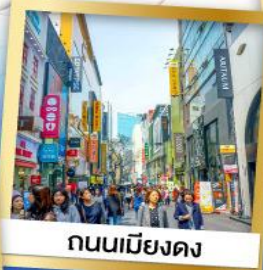
ถนนเมียงดง