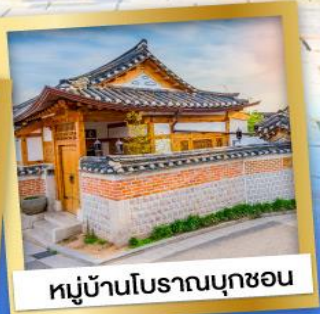
หมู่บ้านโบราณนุคซอน