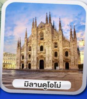
มิลานคูโอโม