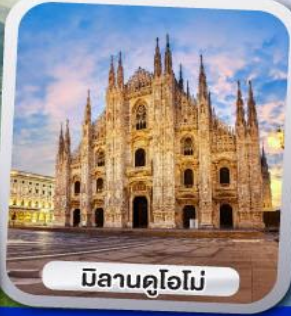
มิลานคูโอโม

✓ ขึ้นกระเช้าหมุน 360 องศา ชมวิวแบบพาโนรามาของยอดเขาทิตลิส