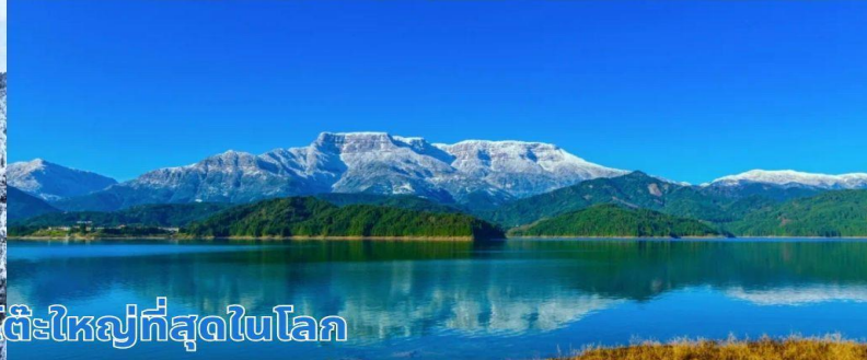
ภูเขาหิมะวาวู ภูเขาโต๊ะใหญ่ที่สุดในโลก