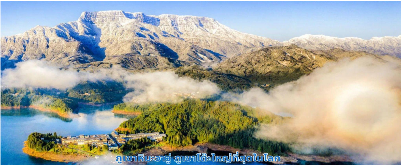
ภูเขาหิมะวาวู ภูเขาโต๊ะใหญ่ที่สุดในโลก