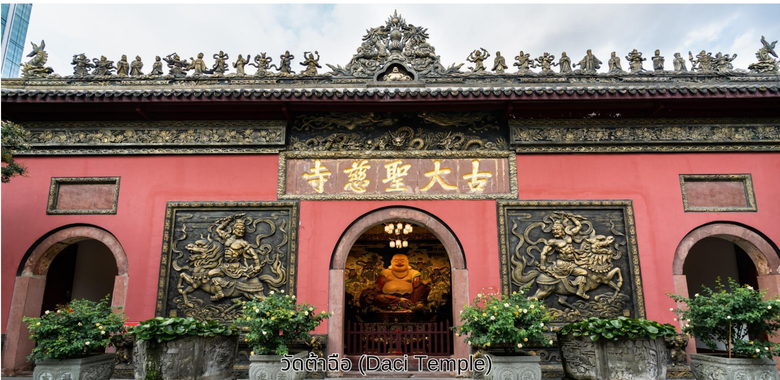
วัดต้าจื่อ (Daci Temple)

เช้า บริการอาหารเช้า ณ ห้องอาหารของโรงแรม