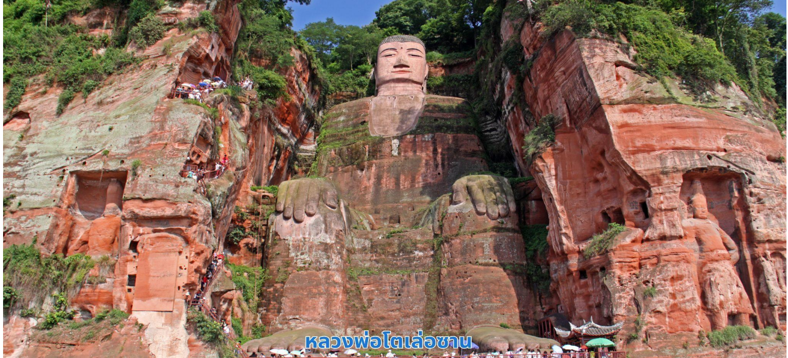
หลวงพ่อดโตเลื้อซาน

นำ นำท่านออกเดินทางไปยัง จ้อไ้ นำท่านชม วัดเป่ากั้ว เป็นวัดที่ใหญ่และสวยงามที่สุดของจ้อไ้ เดิมชื่อว่า ฮุยจงตั้งสร้างขึ้นในสมัยราชวงศ์หมิง เพื่อบูชาพระโพธิสัตว์ผู้เสียนโพธิสัตว์แห่งปัญญาผู้สถิตย์ ณ เขาจ้อไ้ ซึ่งเป็นความเชื่อของ 3 ศาสนาคือ พุทธ เต๋า และลัทธิขงจื้อ ภายในมีโบราณสถานสำคัญคือ ซานเหมิน (ประตูเขา) ตำหนักหมี่เล่อ วิหารหลัก และหอพระคัมภีร์ ซึ่งในปี 1983 วัดเป่ากั้ว ได้ถูกจัดเป็นอีกหนึ่งในจำนวนวัดที่สำคัญที่สุดในจีน