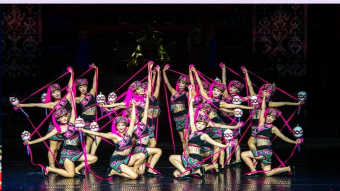
VSYX52SL-3 ไฉไล ไทหล่า เน้นถูกเที่ยวครบ คุ้มมคุ้ม 5วัน2คืน By SL