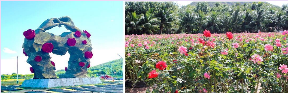
VSX52SL-3 ไฉไล ไทหล้า เน้นถูกเที่ยวครบ คุ้มมมคุ้ม 5วัน2คืน By SL

นำท่านเยี่ยมชม ร้านผ้าไหม ให้ท่านได้เลือกซื้อผลิตภัณฑ์จากไหม ตามอัยาศัย (ใช้เวลาประมาณ 60 - 90 นาที) จากนั้นนำท่านชม ทุ่งดอกกุหลาบอ่าวย่าหลง (รวมรถกอล์ฟ) ให้ท่านได้ เพลิดเพลินกับการถ่ายรูปเพื่อเก็บความประทับใจ และเข้าชมสินค้าที่ผลิตด้วยดอกกุหลาบหลากหลาย เช่น ครีมทาหน้า น้ำหอมกลิ่นกุหลาบ ขนมดอกกุหลาบ เป็นต้น