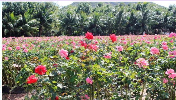
VSYX52SL-3 ไฉไล ไทหล่า เน้นถูกเที่ยวครบ คุ่มมมคุ่ม 5วัน2คืน By SL