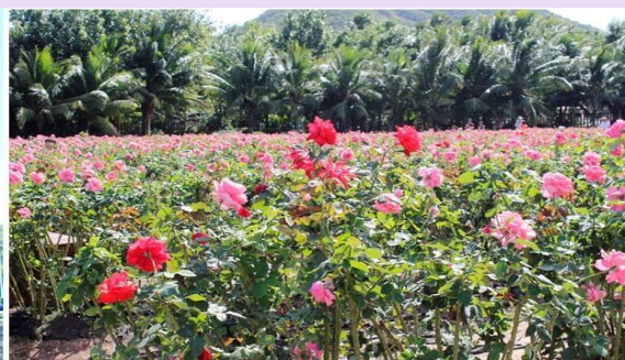
VSX52SL-3 ไฉไล ไทหล่า เน้นถูกเที่ยวครบ คุ้มมมคุ้ม 5วัน2คืน By SL