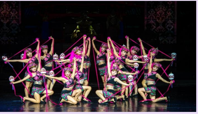
VSX52SL-3 โลโล ไทหล่า เน้นถูกเที่ยวครบ คุ้มมคุ้ม 5วัน2คืน By SL