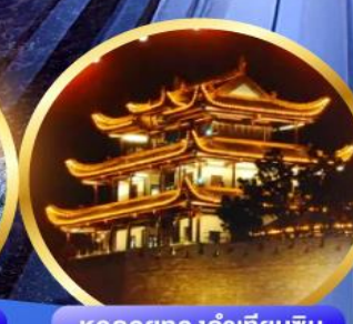
หอคอยทองคำเทียนจิน