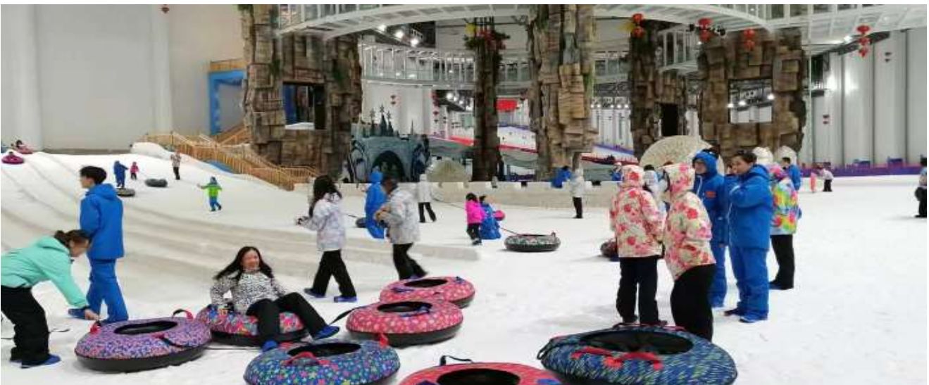
GO1CSX-SL008 บินตรงฉางซา ฉางเต๋อ จางเจียเจีย SNOW WORLD หิมะเหมันต์ เทียวครบ 5 ไร่ไลท์ 6 วัน 5 คืน โดย SL

นำท่านเดินทางสู่ ZHANGJIAJIE ICE & SNOW WORLD (ระยะทาง 126 ก.ม. ใช้เวลาเดินทาง ประมาณ 2 ชั่วโมง) ลานสกีในร่มที่ใหญ่ที่สุดในตอนกลางของจีน! ด้วยขนาดพื้นที่กว่า 60,000 ตารางเมตร และลานหิมะขนาด 27,000 ตารางเมตร ที่รองรับนักท่องเที่ยวได้มากกว่า 1,000 คน ที่นี่ผสมผสานระหว่าง ความบันเทิงบนหิมะและการเล่นสกีได้อย่างลงตัว สนุกกับกิจกรรมสุดมันส์ ไม่ว่าจะเป็น สโนว์บอร์ด หรือ สไลเดอร์น้ำแข็ง (ราคาทัวร์ไม่รวมค่าเช่าอุปกรณ์) ที่นี่ก็สามารถสนุกกับหิมะได้ในทุกฤดู! ไม่ว่าจะเป็น ฤดู ใบไม้ผลิ หรือ หน้าร้อน ก็ยังสามารถสัมผัสความหนาวเย็นสุดฟินได้ทุกวัน