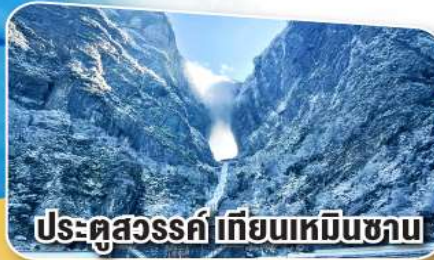
ประตูสวรรค์ เทียนเหมินซาน