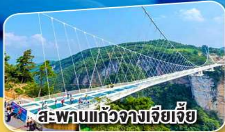
สะพานแก้วจางเจียเจีย