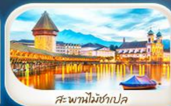
สะพานไมซ์าเปล