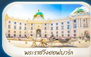
พระราชวังฮอฟบวร์ก

12-18 มี.ค.68 / 19-25 มี.ค.68 28 เม.ย. - 4 พ.ค.68 7-13 พ.ค.68