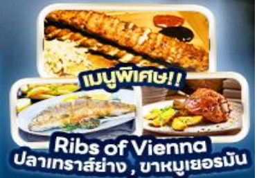
Ribs of Vienna ปลาเทราต์ย่าง, บาหมูเยอรมัน