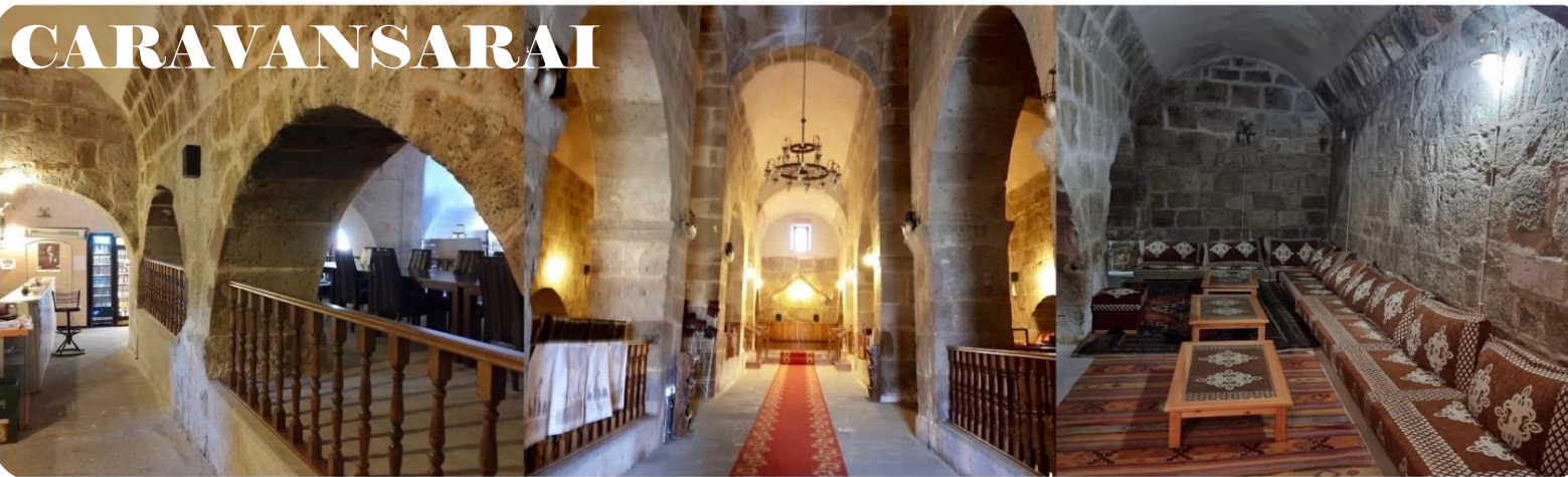
หน้า 8 (ภาพใช้เพื่อพิจารณาโรงแรมเท่านั้น)

จากนั้นเดินทางสู่ ปามุกคาลาเล Pamukkale ใช้เวลาเดินทาง 8 ชม.(630 กม.) ระหว่างทางแวะถ่ายรูป CARAVANSARAI ที่พักรวมระหว่างทางของกองคาราวาที่เดินทางเส้นทางสายไหมของชาวเติร์กในสมัยออตโตมัน มีกำแพงล้อมรอบเพื่อป้องกันลมและฝน รวมทั้งพายุรุนแรงและการปล้นสดมภ์