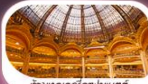
ห้างแลuvre ลูฟฟงแซตตี

Emirates บินทุกวัน น้ำหนักกระเป๋า 30 KG.