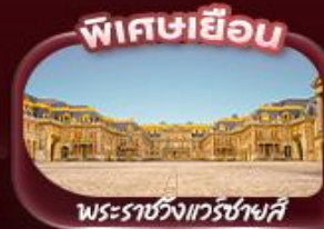
พิเศษเยือน พระราชวังแวร์ซายส์