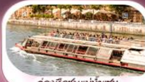
คลองเรือชมแม่น้ำแซน