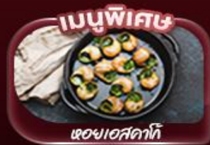
เมนูพิเศษ ของเสียดอกโก้