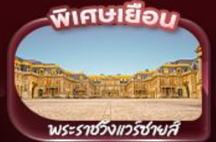
พิเศษเยือน พระราชวังแวร์ซายส์