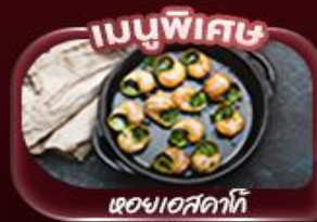
ของแอดคาก์