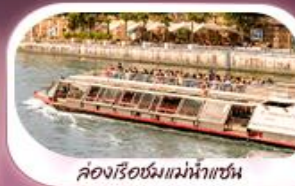
คลองเรือชมแม่น้ำแซน