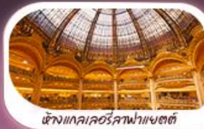
ห้างแลuvre ลูฟวร์