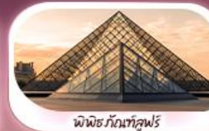
พิพิธภัณฑ์ลูฟวร์