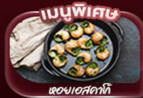
ของแถมพิเศษ